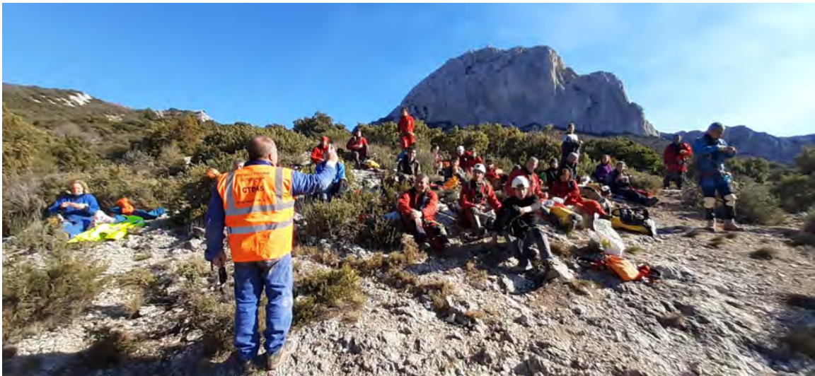
Un incontournable du stage ASV : briefing du CTDSA 13 sur la voie d'accès au jardin suspendu sur le pic de Bertagne