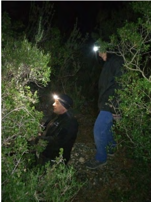
Le PCTA (PC Tres Avancé) du Barbarin : les jambes dans le trou...