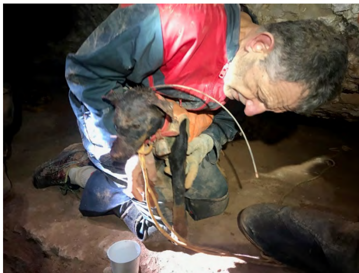
Jay après le sauvetage avec l'assistance de la limande.