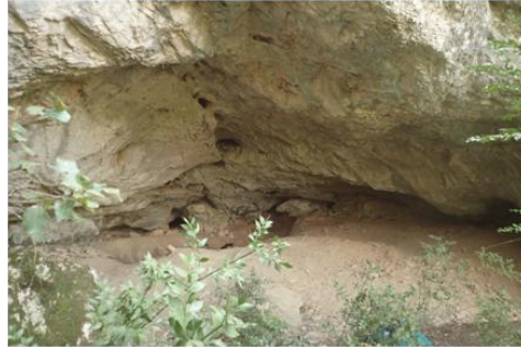
Baume ADA-012.