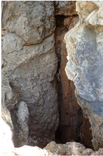
Entrée de l'aven Aubert.