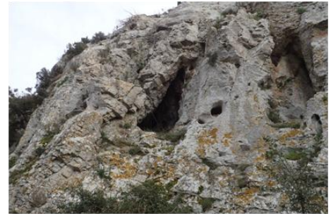
Entrée de la grotte EF-09.

KARSTEAU : secteurs karstiques des Bouches du Rhône (lien).